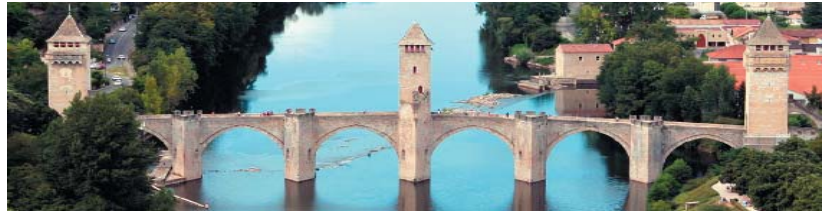
Le pont Valentré - Cahors (Lot)