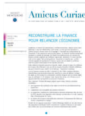
Reconstruire la finance pour relancer l'économie