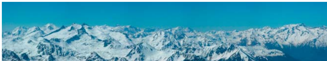
La chaîne des Pyrénées vue du Pic du Midi de Bigorre (Hautes-Pyrénées)