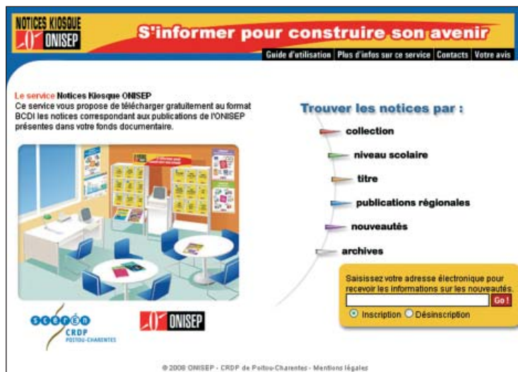
La page d'accueil du site de téléchargement gratuit des notices Onisep

> les fiches métiers de l'Onisep (en ligne)