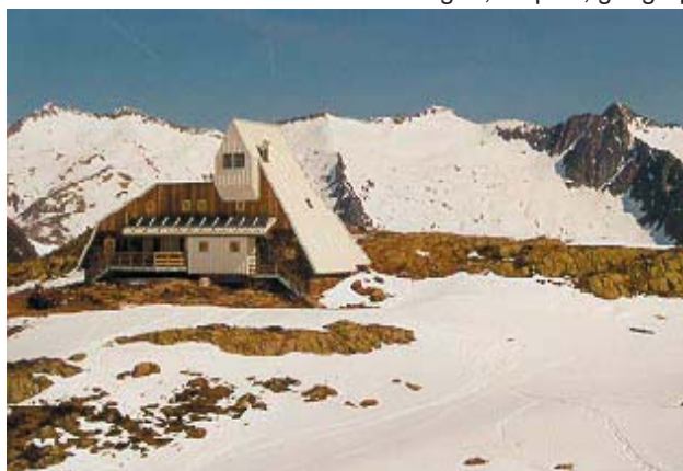
Le refuge du Pinet en Ariège (09)