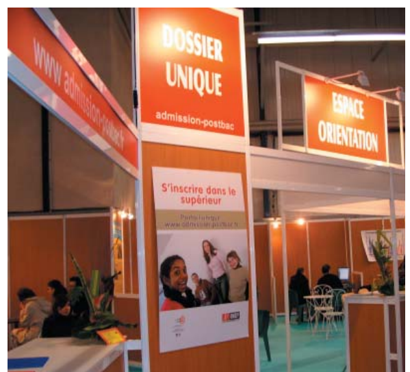
Le stand Dossier Unique au salon Infosup 2008

qui présente les différentes étapes de la procédure et les dates à ne pas manquer.